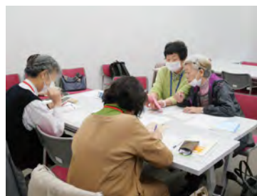
受講前にスキルを チェックする

6月と8月に実施した「初めての人向けスマホ講座」の受講者から 19名が参加してスマホ ステップアップ講座 が10月21日から始まりました。11月4日、18日、12月2日、9日と合計5日間のコースです。以前の講座で学んだ内容の復習と併せて新しいことを学ぶ講座です。また4日目の12月2日は教室から出て近くの中山寺に遠足に出かけてスマホで写真撮影したり、Google マップの実践を体験して学んでいただきます。