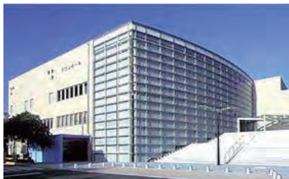
スワンホール

宝塚 NPO センターからの紹介で、 兵庫県伊丹市教育委員会生涯学習部 から中央公民館で行うスマホ講座：基礎編、応用編を1～3月で受託することになりました。伊丹市は私たちの講座内容について非常に評価していて、紹介者である宝塚 NPO センターも同市から感謝されているそうです。