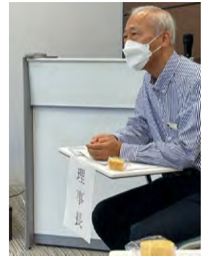
都市魅力研究所での総会風景