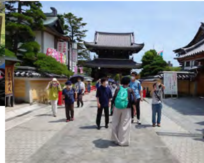
中山寺での撮影実習