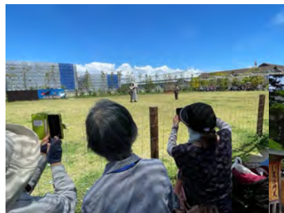
神戸どうぶつ王国での撮影風景