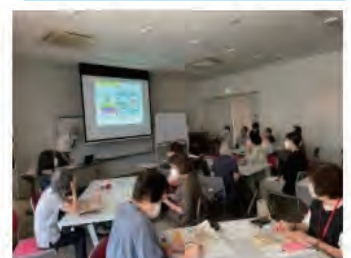
サポーターによるきめ細やかな講習

デジタルトランスフォーメーション（DX）の推進が求められる中、「誰一人取り残さない」社会を目指し、同年代のサポーターを配置し、繰り返し学習の機会を設けるなど、高齢者目線に立ったスマホ講座を実施。併せて、高齢者のプチ就労の一環としてシニア向けサポーター養成講座を実施