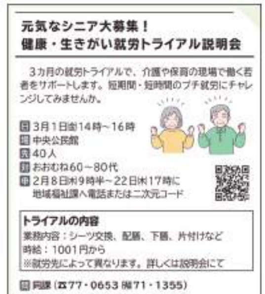
宝塚市就労トライアル募集記事(広報たからづか2月号より)